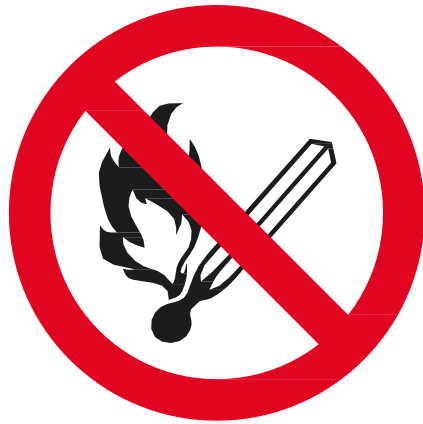
Rökning och öppen eld förbjuden

Vid tankning ska regler för den EX-klassade zoner följas i enlighet med gällande standarder och anläggningsspecifika regler: