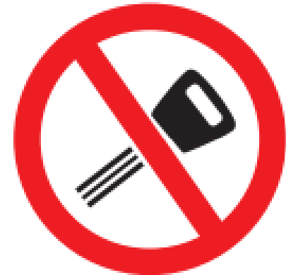
Motor avstängd under tankning